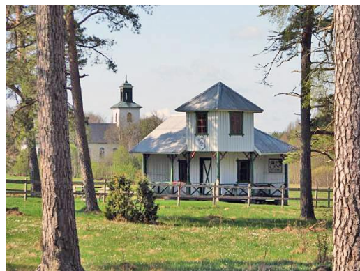
Skyttepaviljongen och Jälluntofta kyrka

Museet är öppet söndagar 23 juni till 18 augusti kl. 13–15.